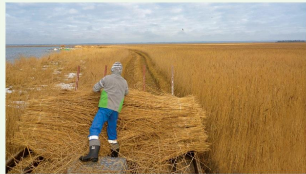
Koszenie szwaru trzcinowego na wyspie Wielki Krzek

W celu stworzenia lepszych warunków do realizacji planowanych zabiegów przyrodniczych w ramach projektu ulepszono infrastrukturę techniczną. Na terenie siedziby Obrębu Wodnego w Wapnicy umocniono linię brzegową i wybudowano przystań tożdziową z możliwością cumowania czterech jednostek.