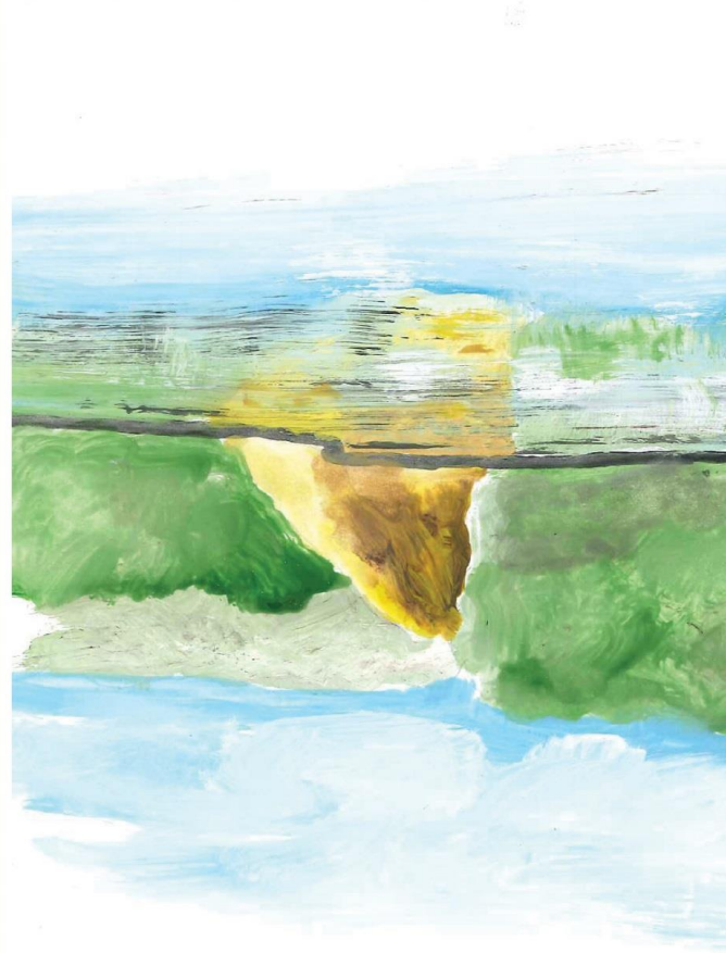
Góra Parkowa nad Jeziorem Turkusowym, rys. Piotr Barański

Turyści indywidualni oraz grupy zorganizowane mogą korzystać z miejsc noclegowych udostępnianych przez Woliński Park Narodowy m.in. w Kompleksie Edukacyjnym Grodno 1 i Kompleksie Edukacyjnym Białej Góry. Kompleksy położone są wśród pięknych bukowych lasów w pobliżu morza. Miejsca te cechuje cisza, niezakłócony spokój oraz bliskość przyrody. Grupy mają możliwość skorzystania z Bazy Edukacyjnej Biała Góra. Obiekt znajduje się w odległości około 2 km od Międzyzdrojów na terenie byłej jednostki wojskowej. Pokoje są udostępniane po wcześniejszej rezerwacji w dziale administracji parku.