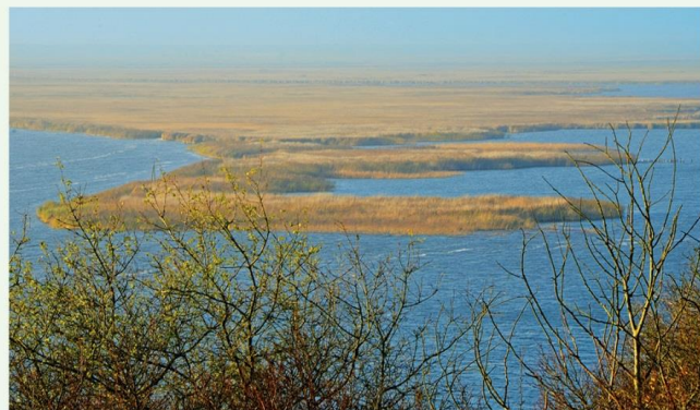
Wsteczna Delta Świny

W skład Dłty wchodzi archipelag 44 wysp o łącznej powierzchni około 3650 ha. Największe z nich to Karsiborska Kępa, Wielki Krzek i Warnie Kępy. Na wyspach znajdują się najbardziej rozległe w Polsce kompleksy łąk solniskowych. Wszystkie wyspy są podmokłe, niezamieszkałe i w większości niezagospodarowane. Na niektórych prowadzony jest wypas krów i koszenia w celu zachowania siedlisk dla ptaków siewkowych min. biegusów, kulików, rycyków i krwawodziobów, czy niezwykle rzadkiej wodniczki. Wyspy powstały w wyniku akumulacji piasku i mułu osadzanego przez wody Świny pchanej wstecznym prądem podczas silnych sztormów z wiatrem wiejącym z kierunku północnego (zjawisko tzw. cofki). Ocenia się, że delta ma około trzech tysięcy lat. Znaczna część dłty leży w granicach Wolińskiego Parku Narodowego. Wyspy Karsiborska Kępa i Bielawki stanowią tzw. społeczne rezerwat. Jest to teren poddany ochronie przez Ogólnopolskie Towarzystwo Ochrony Ptaków. Większość ptaków występujących na wyspach możesz zobaczyć w naszym Muzeum Przyrodniczym w Międzyzdrojach.